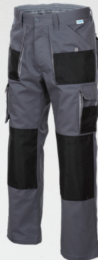
Spodnie do pasa / Trousers