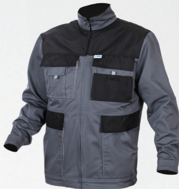
Bluza / Jacket