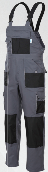
Spodnie ogrodniczki / Bib and brace