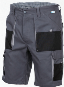
Spodnie krótkie / Shorts

V Nie czyścić chemicznie / Do not dry clean